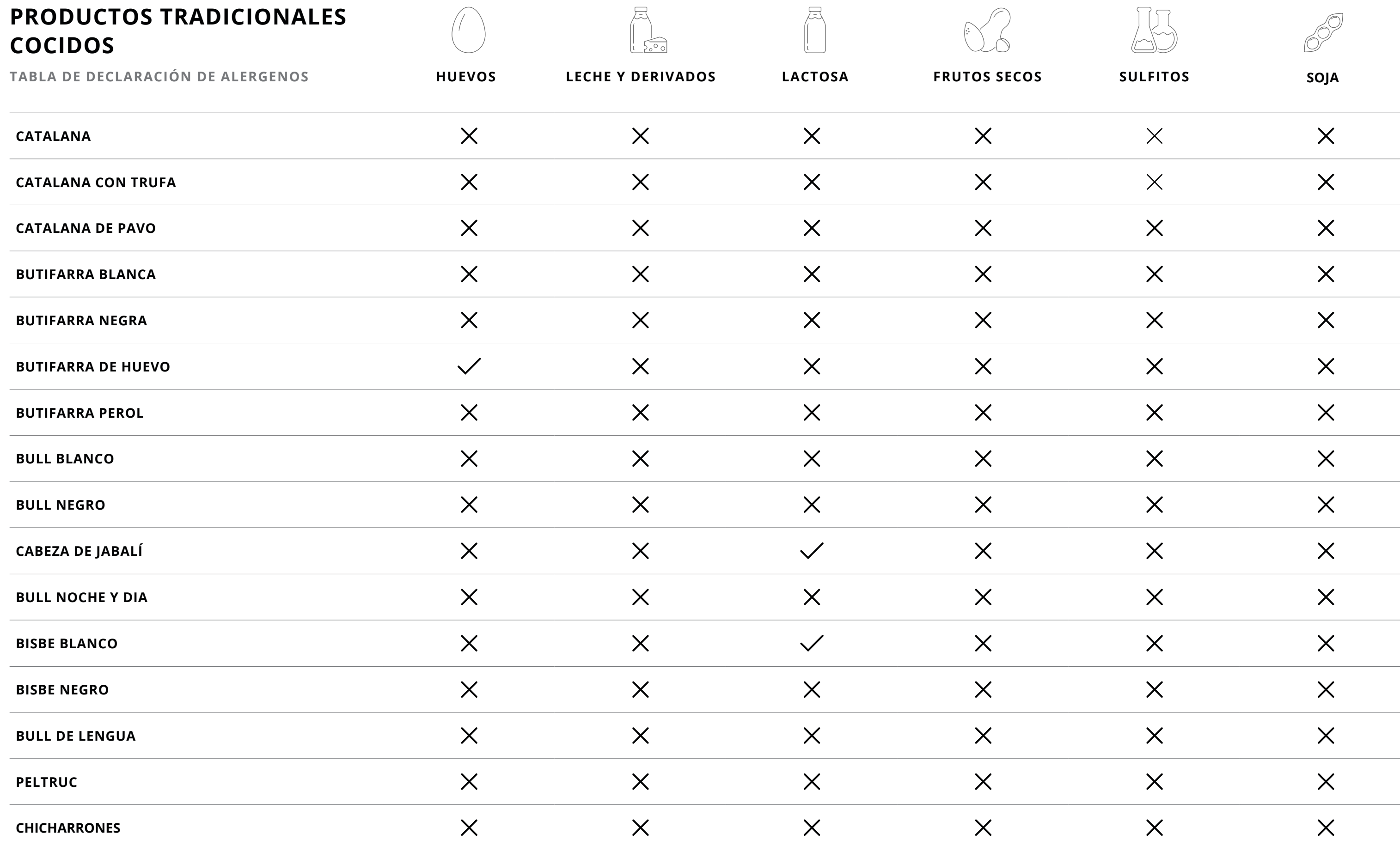
TABLA DE DECLARACIÓN DE ALERGENOS